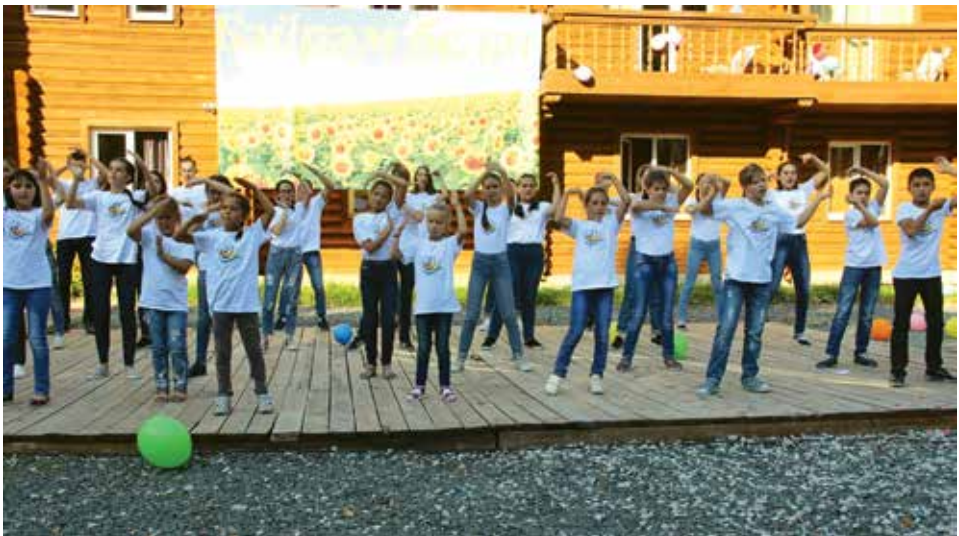
Новосибирск өлкәсенең татар балалары өчен профиль смена