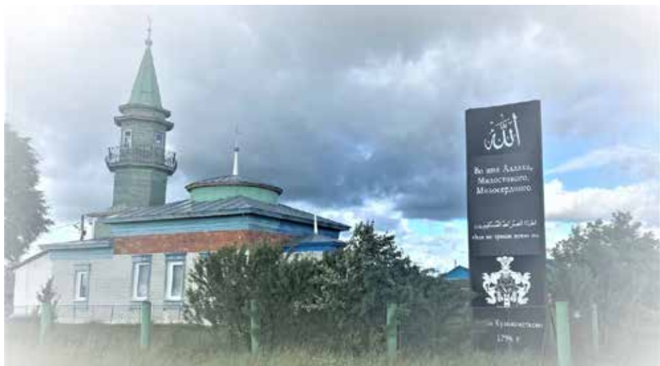
Деревня Сабанаки Тобольского района.

донес губернатору Сибири М.П.Гагарину, «что он Хаип хан с царским величеством желает быть в вечном мире» [Памятники Сибирской истории XVIII в.: 1885. Кн. 2. С. 152].