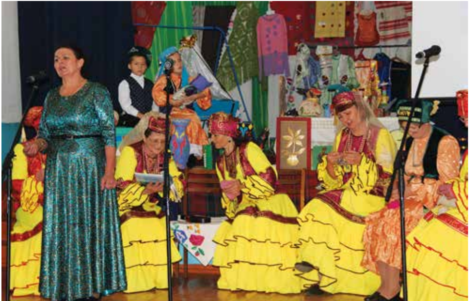
«Минем татар авылым» бәйгесе. Новосибирск