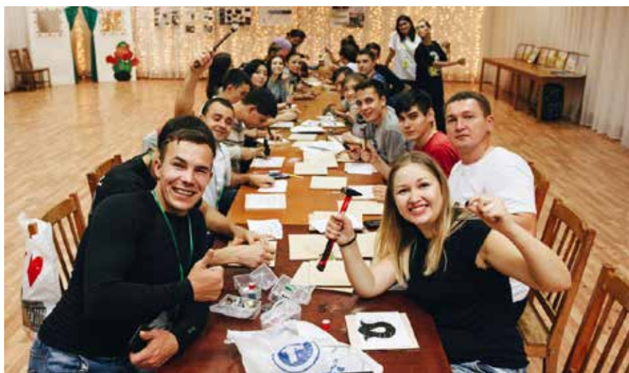
Сибирский фестиваль татарской молодежи

Под крылом НОТКЦ плодотворно работают 12 клубных формирований, ежегодно проводится свыше 60 массовых мероприятий, развивается сотрудничество с областными учреждениями культуры, коллективами национальных центров, самодеятельными и профессиональными вокальными и хореографическими коллективами, школами, колледжами и вузами. Работники НОТКЦ как участники или члены жюри принимают участие в различных фестивалях и конкурсах, форумах и съездах, транслируют и продвигают татарскую культуру по всей России и за ее пределами.