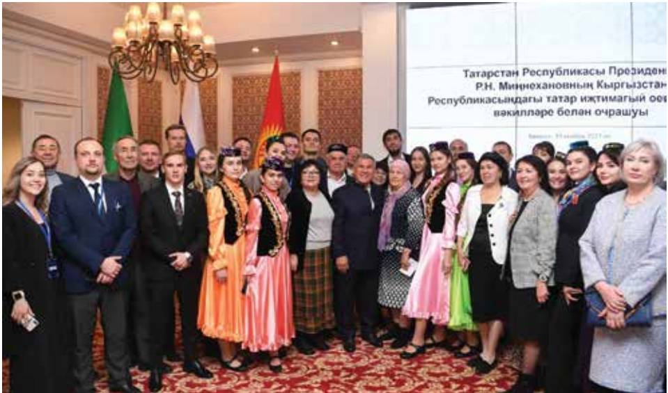
Кыргызстан татарларының Татарстан Республикасы Президенти Р.Н. Миңнеханов белән очрашуы