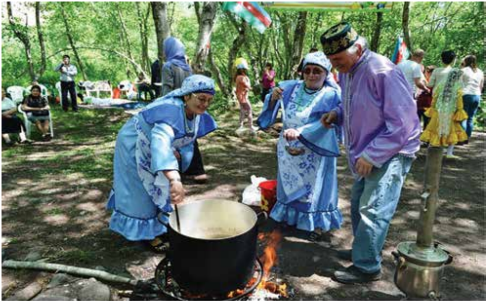
«Туган тел» оешмасы тарафыннан оештырылган «Карга боткасы» бәйрәме. Баку