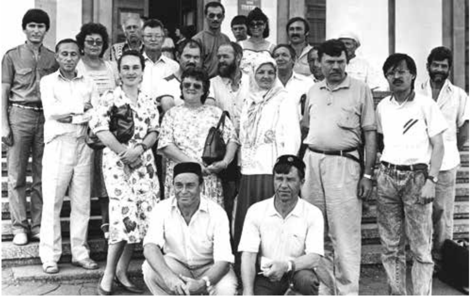
Төркиядәге милләттәшләрбезнең Татарстанга беренче сәяхәте, 1991 ел.