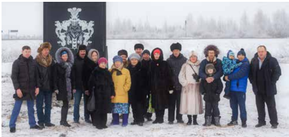
Династия Кульмаметевых после установки стелы