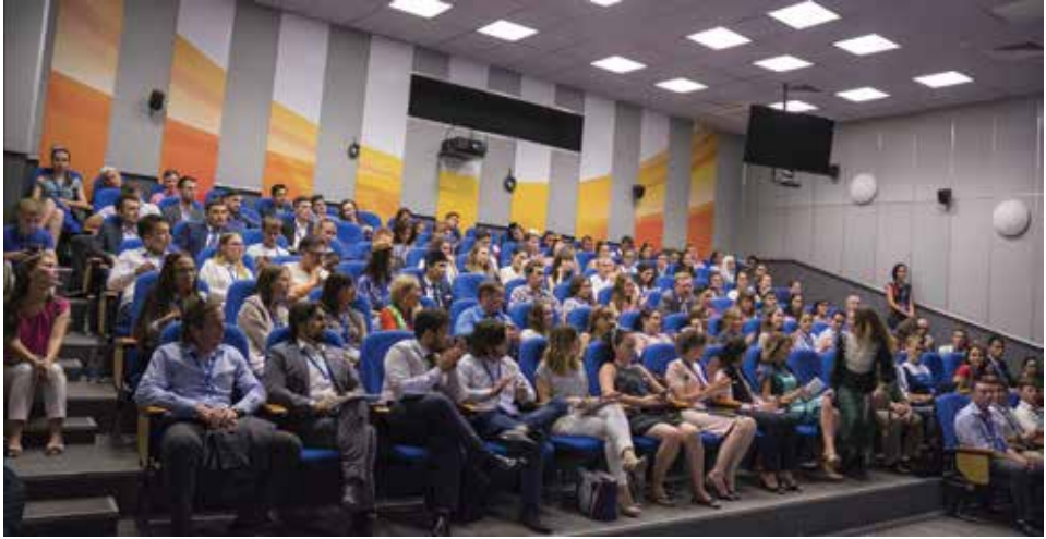
Бөтендөнья татар яшьләре форумы Идарәсенең киңәйтелгән утырышы