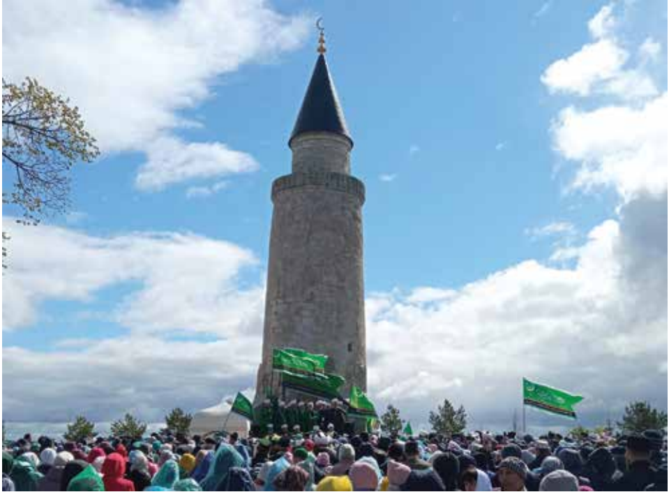
«Болгар жьыены», 2022 ел