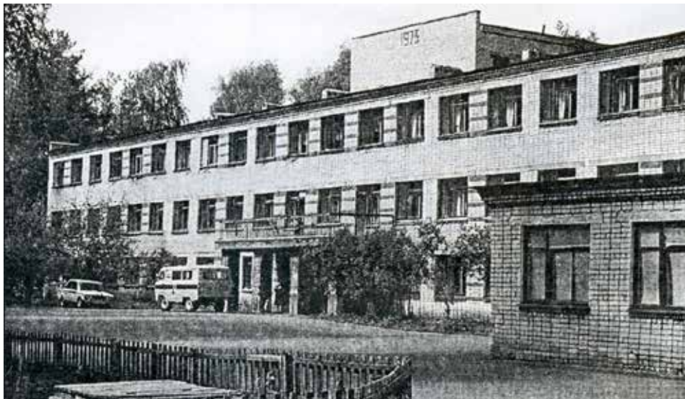
Главный корпус ЦРБ, введенный в эксплуатацию в 1974 г.