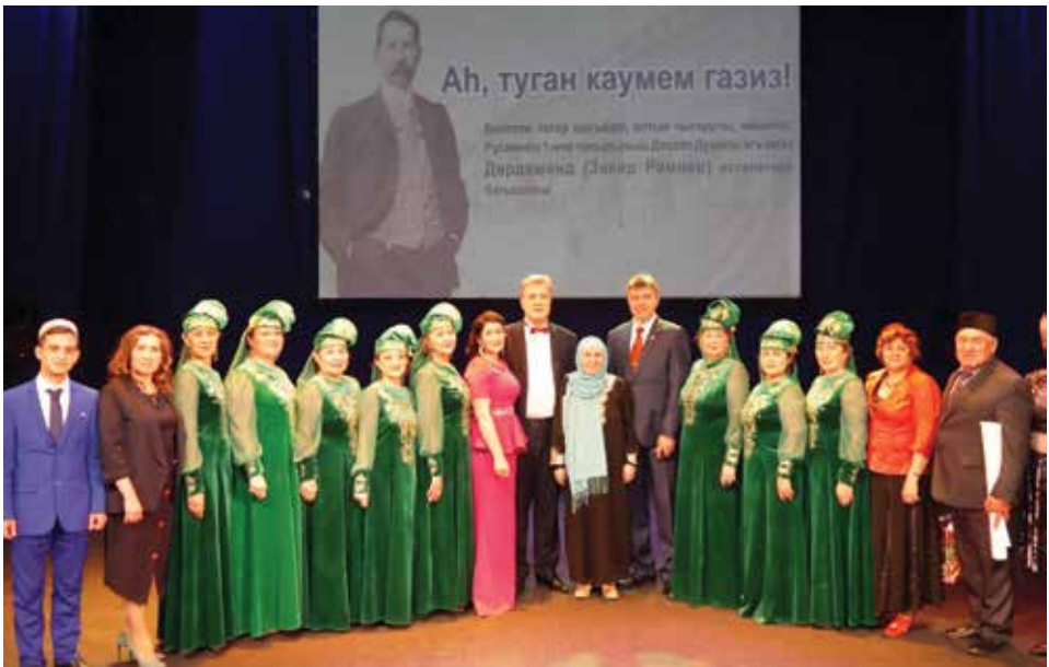
Дәрдемәнднең 160 еллыгына багышланган кичә. Уфа