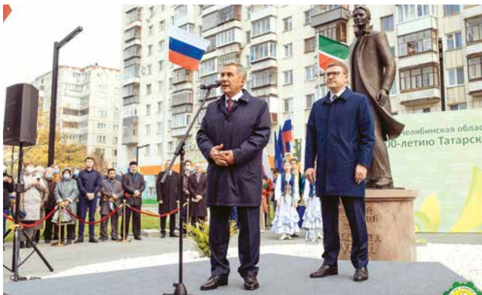
Чиләбе шәһәрендә Габдулла Тукайга һәйкәл ачу