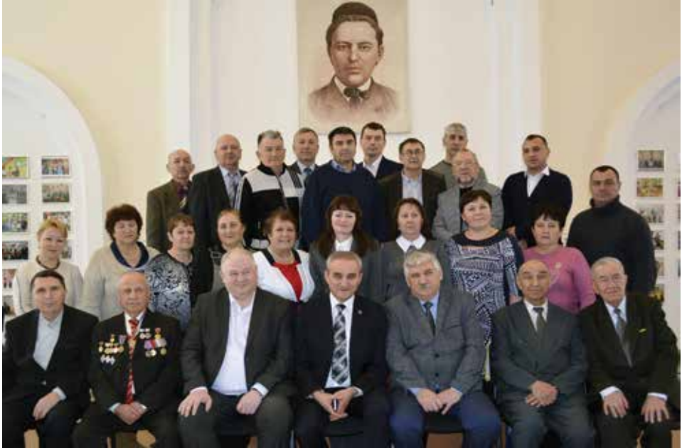
Ульяновск шәһәрндә узган Өлкә татар төбәк тарихын өйрәнүчеләр форумында