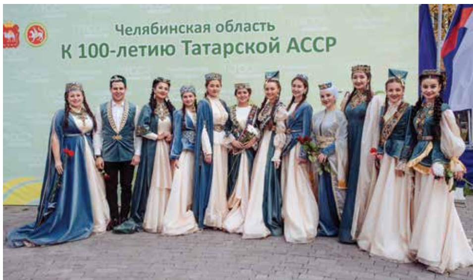
Чиләбе шәһәре татар яшьләре кунаклар каршылыгый