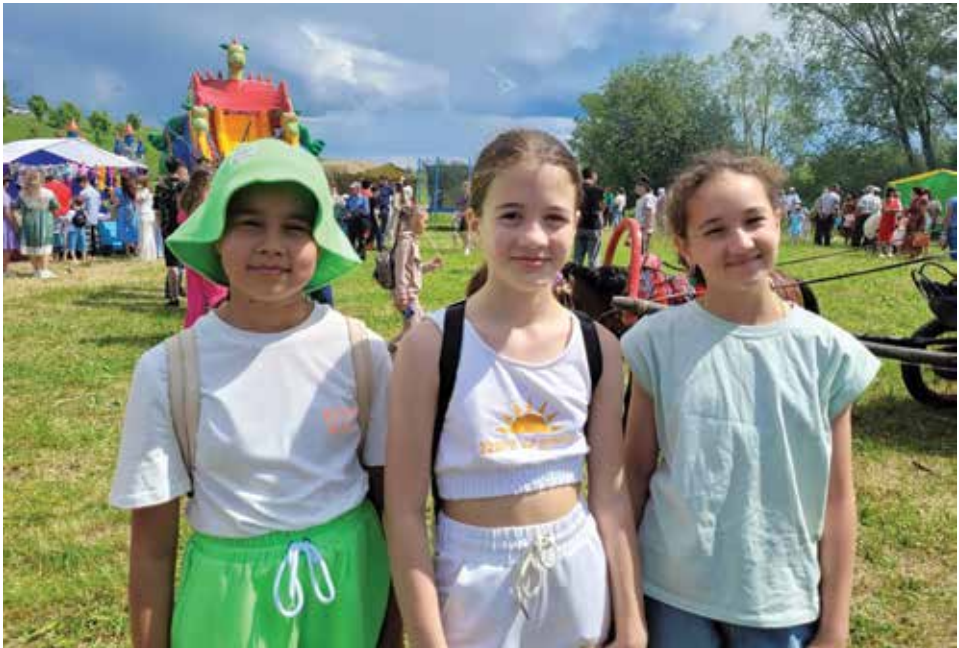
Татар кызлары Мари Иле Сабан туенда