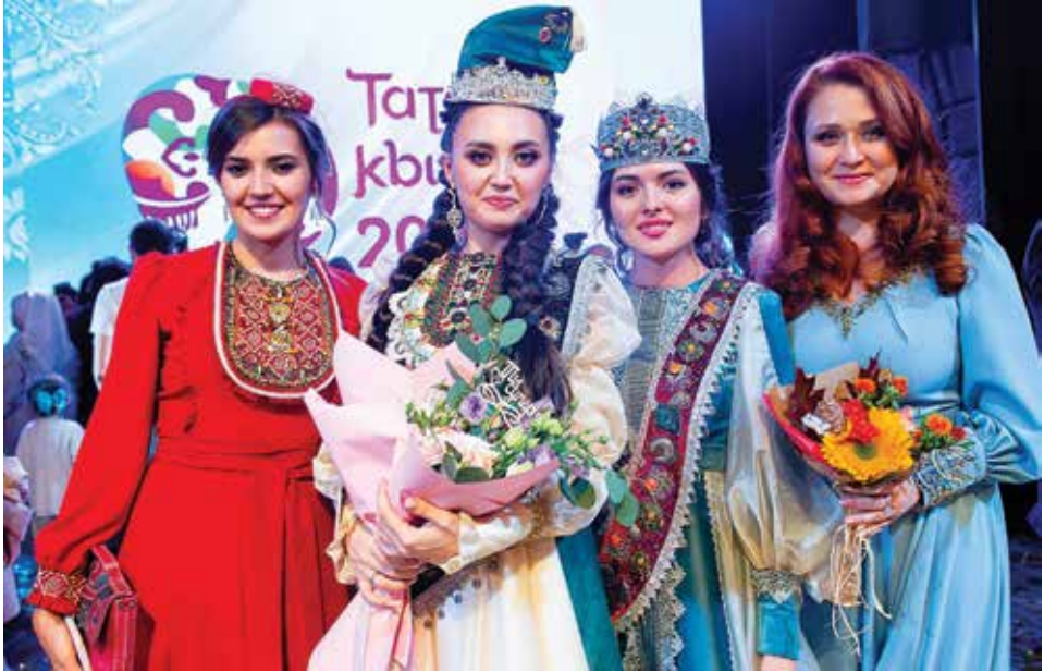
Халыкара «Татар кызы» бәйгесе финалы