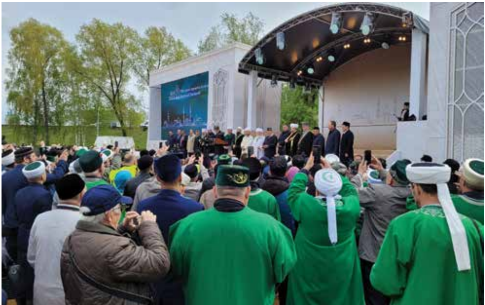
Казанда төзеләчәк яңа Жәмигь мәчетенә таи кую тантанасы