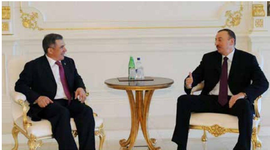
Встреча Президента Республики Татарстан Рустама Минниханова с Президентом Азербайджанской Республики Ильхамом Алиевым

Осуществляются визиты и на высшем уровне. 2 марта 2011 г. состоялся визит Президента РТ Рустама Минниханова в Баку, 23 июня с ответным визитом, Казань посетил Президент Азербайджанской Республики Ильхам Алиев.