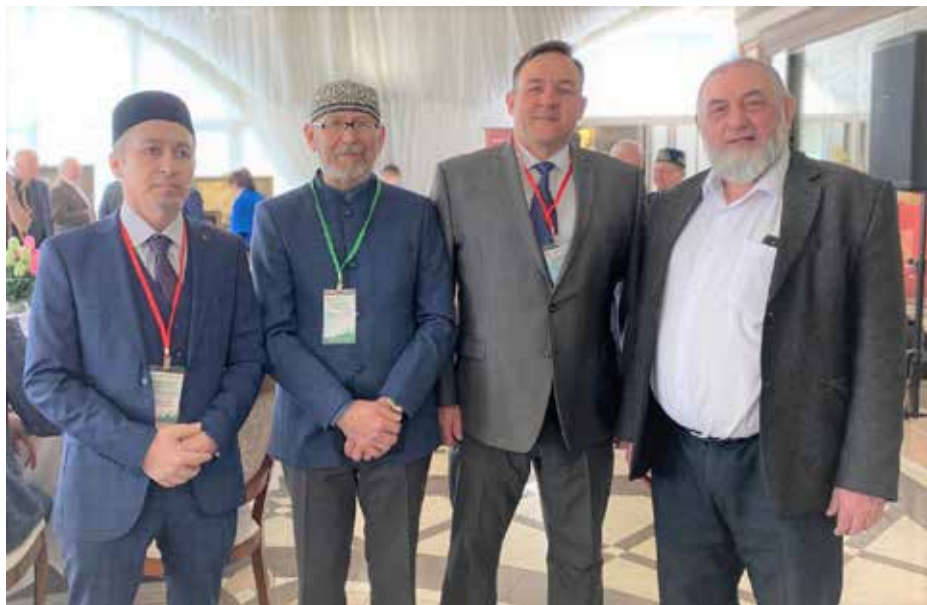
Во время конференции, посвященный принятию ислама предками татар в Волжской Булгарии. Пенза, 2022

На самом деле татары-мишари – это просто татары. Без всяких приставок типа «мишари» или «мещеряки». Как же появилось слово «мишэр»? Регион этногенеза татар-мишарей в старых русских документах, как говорилось, назывался «Мещерой». Причем под понятием «Мещера» в разное время подразумевалось пространство разных размеров. Московские чиновники жителей этого региона, поэтапно присоединенного к их государству в XV–XVI вв., называли «мещерянами» и «мещеряками» – причем не только татар, но и русских.