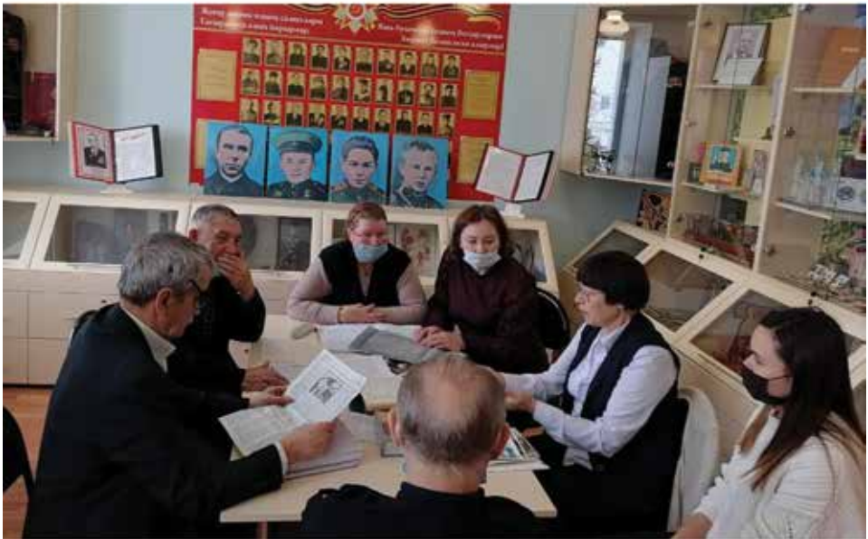
Сабада «Төбәк тарихын өйрәнүчеләр» клубы утырышы