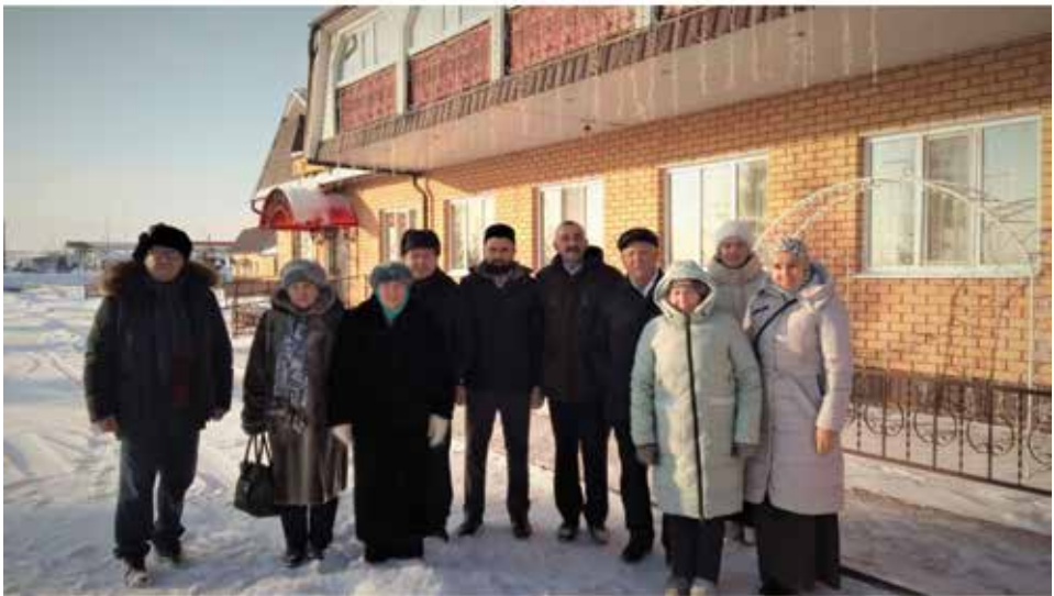
Теләчедә очрашулар. 2021 елның декабре