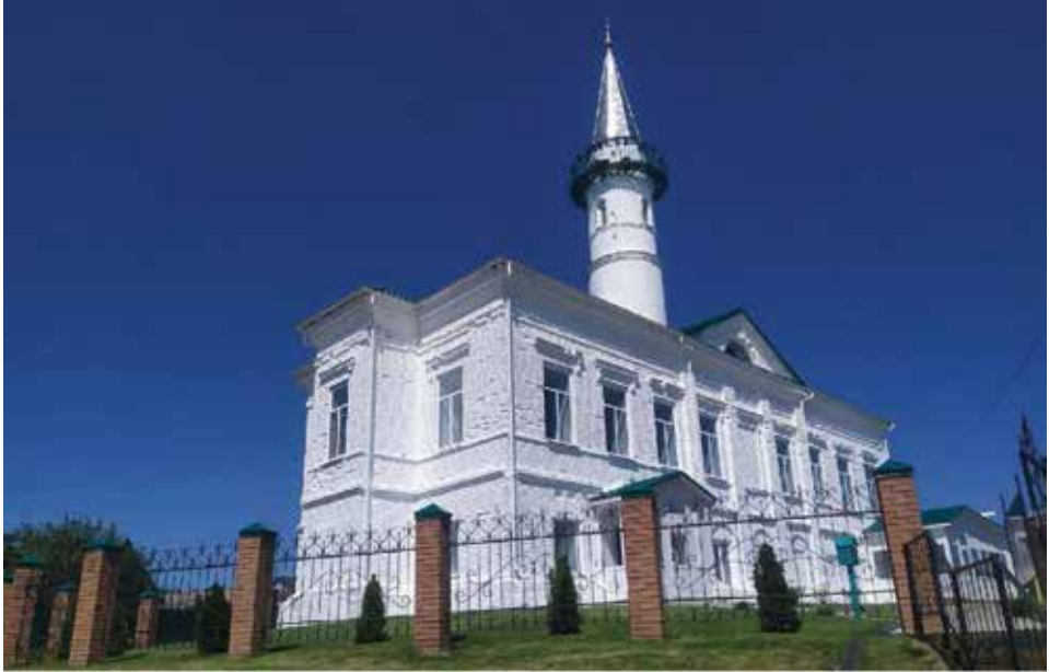
Бэрэңге районы Мазарбаиш авылы мәчете