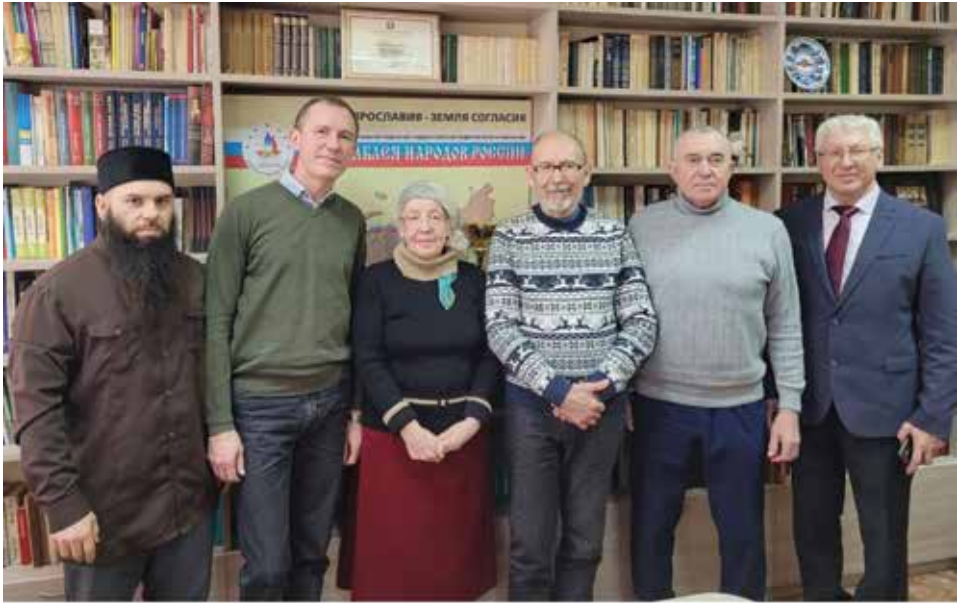
Ярославль өлкәсе татар милли-мәдәни автономиясе активы белән. 24.02.2022