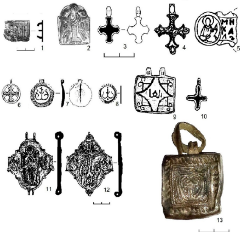
Рис. 1. Исламские и христианские предметы со средневековых поселений Верхнего Посурья

Никольского поселения размещались одновременно как мечеть, так и христианский храм. Сохранились летописные сведения, свидетельствующие о том, что в 1261 г. в столице Орды – г. Сарае митрополитом Кириллом II с разрешения хана Берке была учреждена православная епархия, хотя Берке был первым из правителей монгольского рода Чингизидов, кто принял ислам.