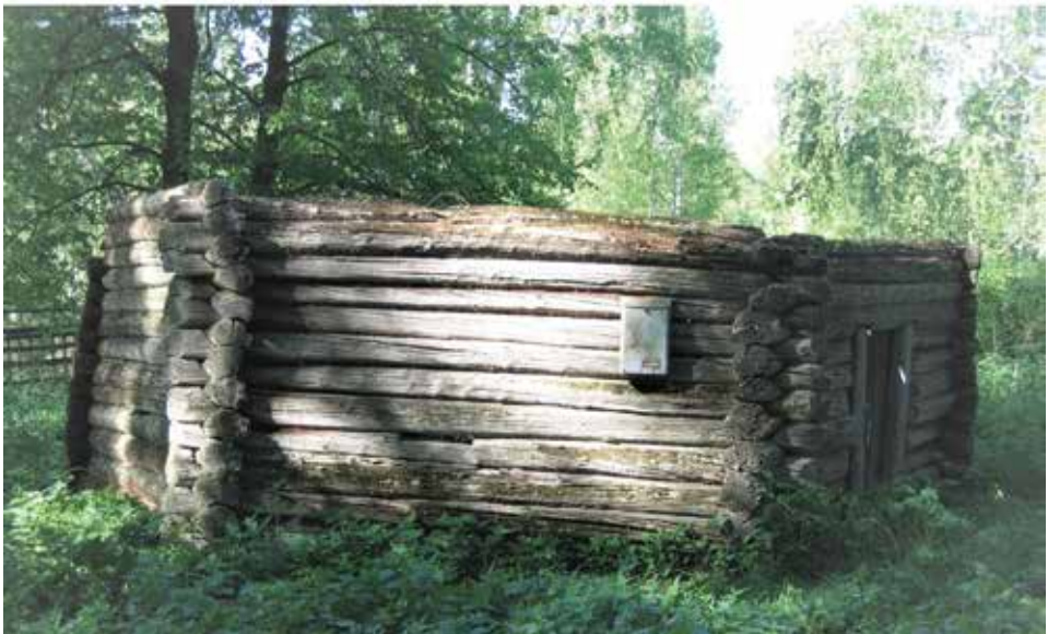
Төмән өлкәсендәге Ләцек (Тахтагул) авылы астанасы. XIX гасыр бурасы.