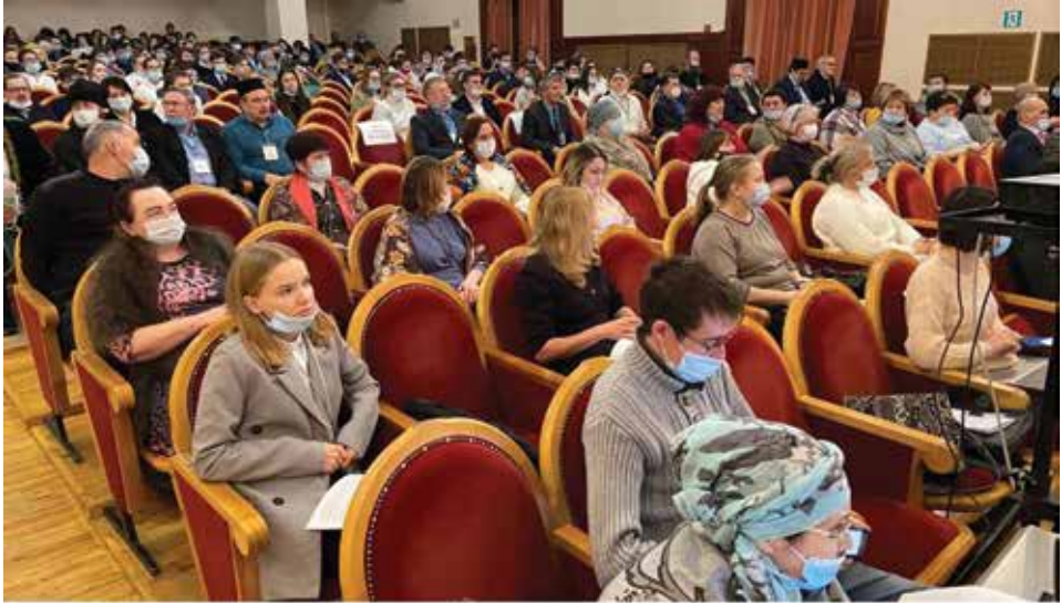
Питрэчтэ Мәүлә Колыйга багышланган конференция